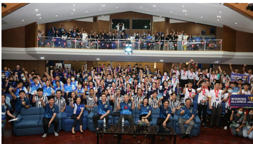
ภาพที่ 5 “ทีม SWB โรงเรียนสระบุรีวิทยาคม” ได้รับรางวัล Winning Alliance Award, Connect Award และ Control Award ในการแข่งขัน FIRST Tech Challenge, THAILAND 2020 วันที่ 9-11 ธันวาคม 2563