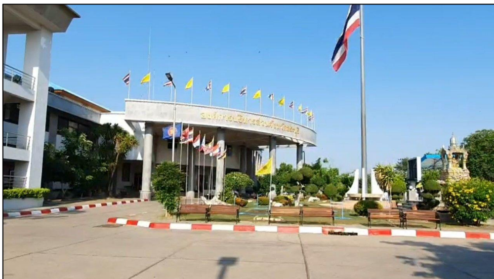
ภาพที่ 2 สำนักงานองค์การบริหารส่วนจังหวัดสระบุรี

ผลการประเมินประสิทธิภาพขององค์กรปกครองส่วนท้องถิ่น (LPA) ปี 2563 ผ่านในระดับ “ดี” คิดเป็นร้อยละ 74 ส่วนผลการประเมินระดับคุณธรรมและความโปร่งใส (ITA) ประจำปี 2564 ผ่านในระดับ “A” ได้คะแนน 88.68 คะแนน